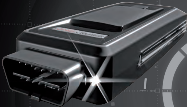
Lampenfunktion zur Beleuchtung des OBD Verbinders